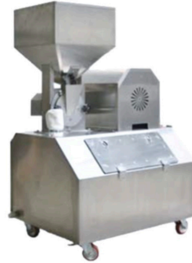
PUDRA ŞEKERİ DEĞİRMENİ SUGAR MILL INV PD 01