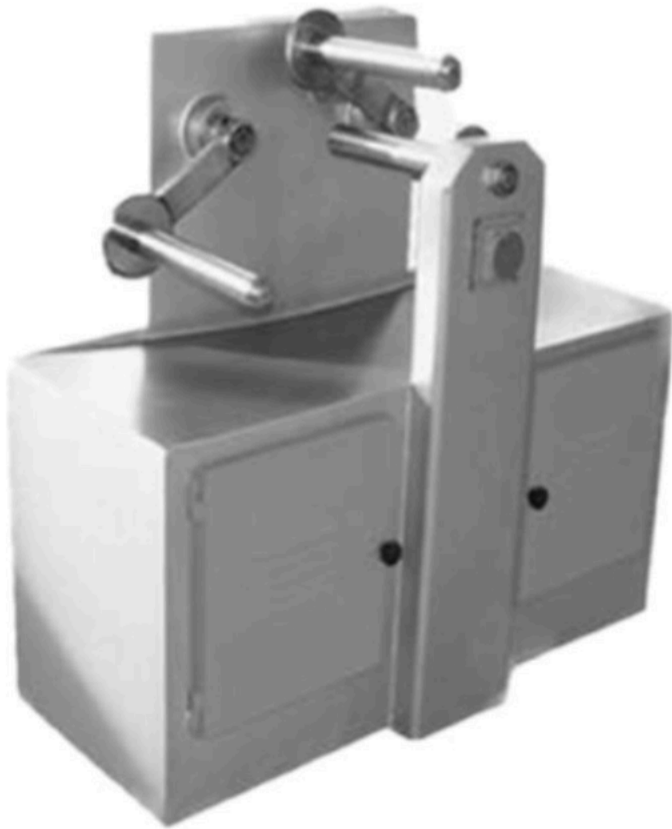
ŞEKER AĞARTMA MAKİNASI SUGAR WHITENING MACHINE INV PSA 01