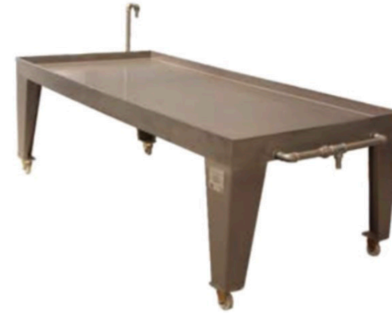
PİŞMANİYE ŞEKER SOĞUTMA BANYOSU SUGAR COOLER INV SB 01