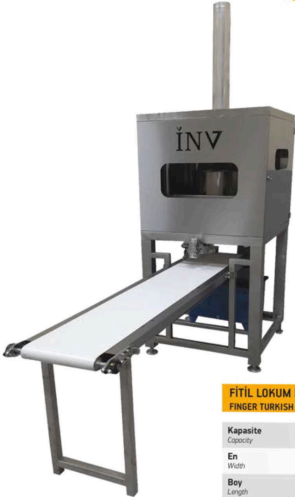
FİTİL LOKUM MAKİNASI FINGER TURKISH DELIGHT MACHINE INV FL 01