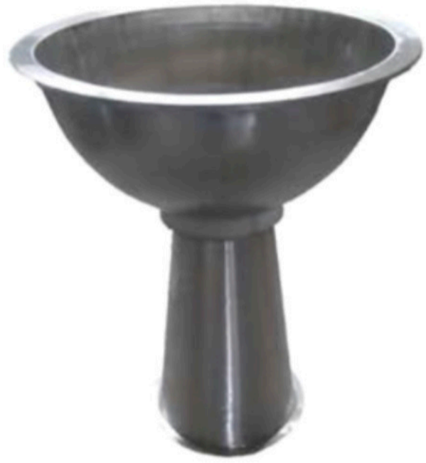
HELVA YOĞURMA KAZANI HALVA DOUGH KNEADING