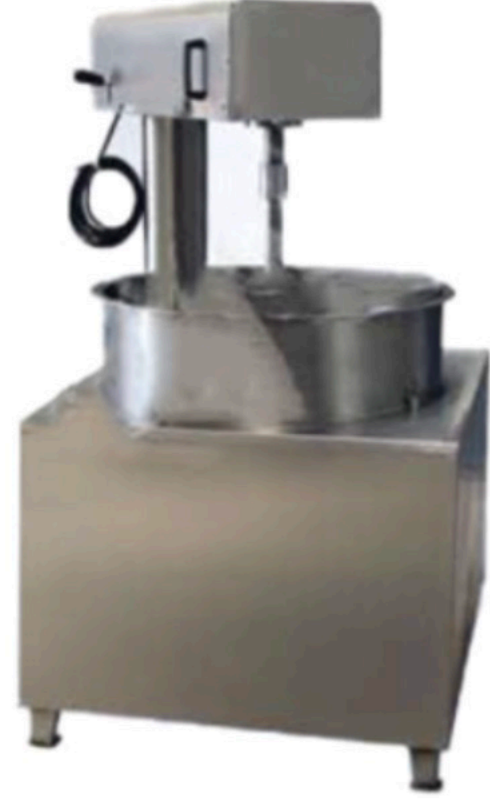
PİŞMANİYE HAMUR ISITMA TURKISH FAIRY FLOSS DOUGH HEATING MACHINE INV PHI 01