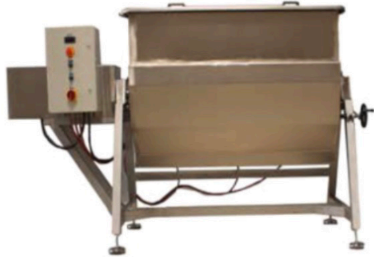
PİŞMANİYE HAMUR PİŞİRME DOUGH COOKER MACHINE INV PHP 01