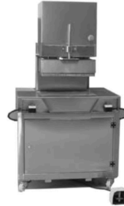
SARAY HELVA PRESİ HALVA SHAPER PRESS MACHINE INV SP 01