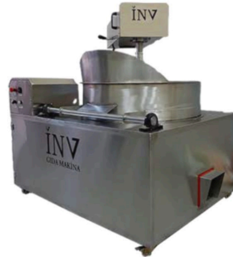
GAZLI LOKUM PİŞİRME KAZANI INV LP 02 TURKISH DELIGHT COOKING MACHINE CHROME