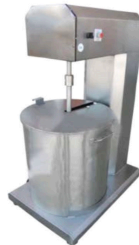
ÇÖĞEN MİKSERİ SAPONARIA MIXER INV M 01