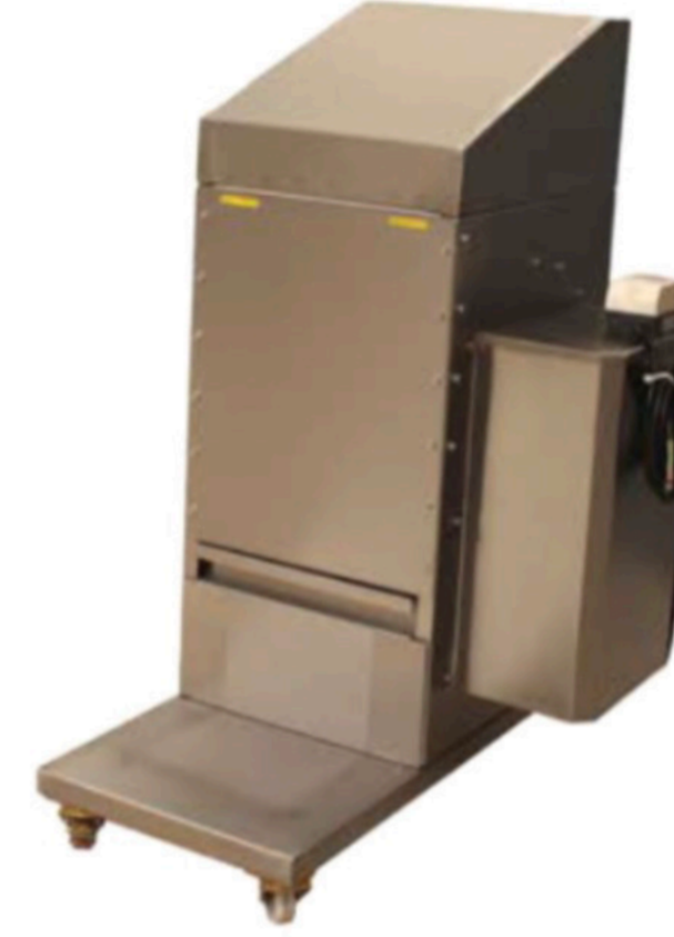
PİŞMANİYE KIRMA (SARAY HELVA ÖĞÜTME MAKİNASI) GRINDING MACHINE INV PK 01