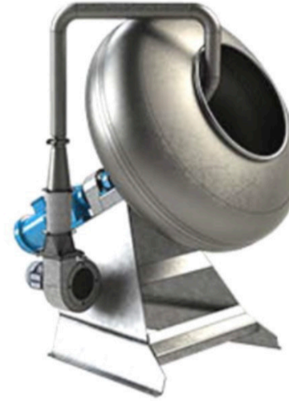
KURUYEMİŞ VE DRAJE KAPLAMA MAKİNASI DRAGEE COATING MACHINE