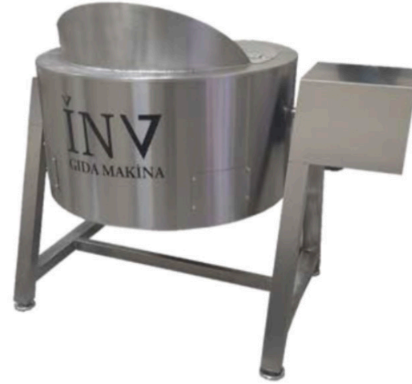
ELEKTRİKLİ LOKUM PIŞİRME KAZANI INV LP 03 TURKISH DELIGHT COOKING MACHINE (POWER OPERATED)