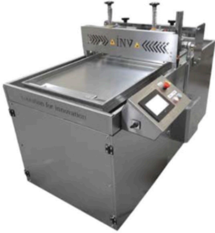
OTOMATİK TABLALI LOKUM KESME MAKİNASI INV LK 02 AUTOMATIC TURKISH DELIGHT CUTTING MACHINE