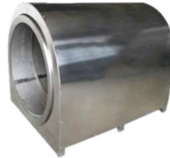
JÖLE - LOKUM KAPLAMA TAMBURU ROTARY DRAGEE COATING MACHINE