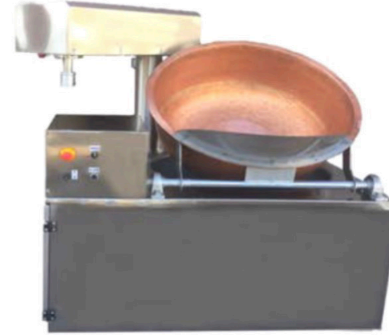
GAZLI LOKUM PİŞİRME KAZANI INV LP 01 TURKISH DELIGHT COOKING MACHINE COPPER

The aim of our company is to carry out studies that will decrease the manpower, increase the production, and produce machines that bring quality to the forefront with R&D studies.