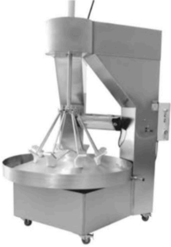
PİŞMANİYE ÇEKME MAKİNASI COTTON CANDY PULLER MACHINE INV PC 01