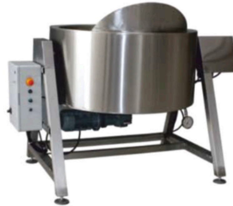
BUHARLI LOKUM PIŞİRME KAZANI INV LP 04 TURKISH DELIGHT COOKING MACHINE (STEAM HEATING SYSTEM)