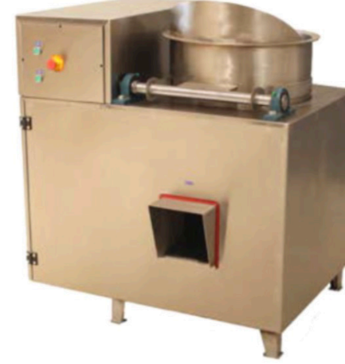
PİŞMANİYE ŞEKER KAYNATMA MAKİNASI SUGAR BOILER INV PSK 01