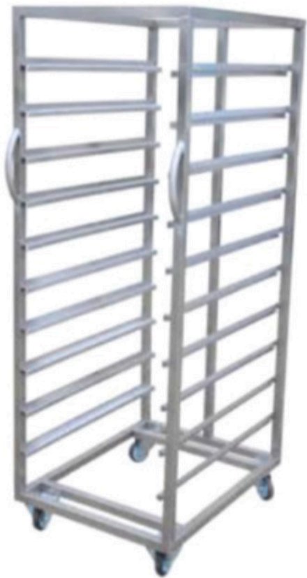
TABLA TAŞIMA ARABASI INV TA 01

DİNLENDİRME TABLALARININ TAŞIMASI İÇİN UYGUNDUR. PASLANMAZ PROFİL VE SACDAN İMAL EDİLİR. İSTENİLEN ÖLÇÜLERDE İMALATI MÜMKÜNDÜR.