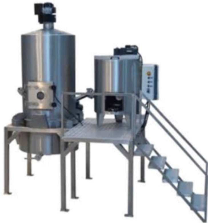
HELVA ÇIRPMA VE ŞEKER KAYNATMA PLATFORMU HALVA SHERBET MIXER